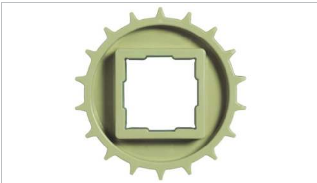
Piñón de una pieza (sólido)

Otros materiales disponibles a petición.