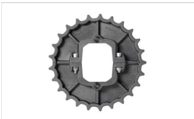
Multi-Hub sprocket (Z-H)