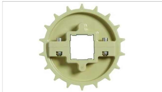
Piñón partido en dos