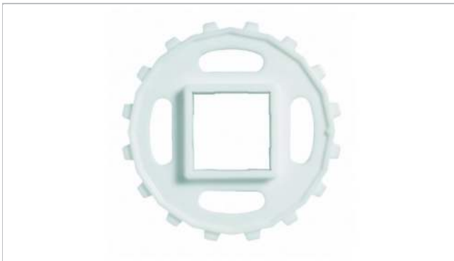
Piñón de una pieza ("ventana abierta")

Otros materiales disponibles a petición.