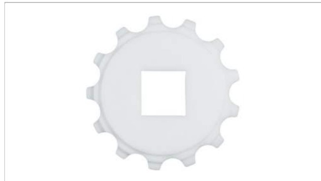
Piñón de una pieza (sólido)