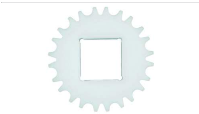
Piñón de una pieza (sólido)

Otros materiales disponibles a petición.