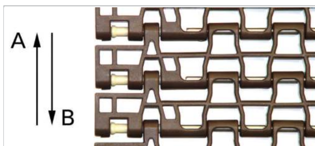
M2585-S0, borde izquierdo XL (similar a M2585-P0, M2586)

* X_L and X_R se relacionan con la dirección de marcha A y a la inversa con la dirección de marcha B.