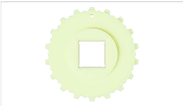
Piñón de una pieza (sólido)

Otros materiales disponibles a petición.