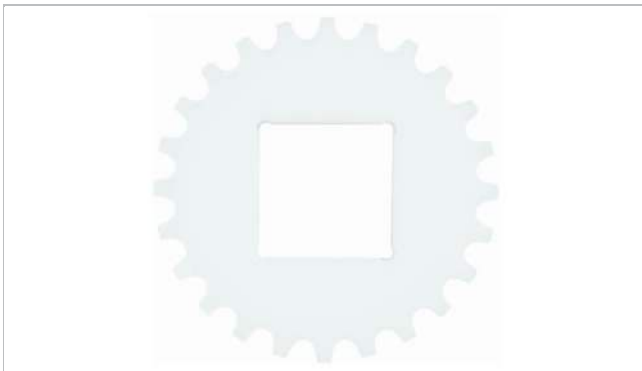
Piñón de una pieza (sólido)

Otros materiales disponibles a petición.